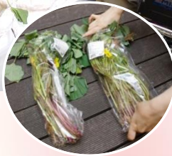
「大きなお芋に育つのよー」

梅雨入り前の6月に入居部で『芋植えレクリエーション』を開催しました。今秋、みんなで食べる大きな大きな芋が収穫できるのを想像しながら芋植えを行いました。今回は土のう袋を使用し芋植えを実施。