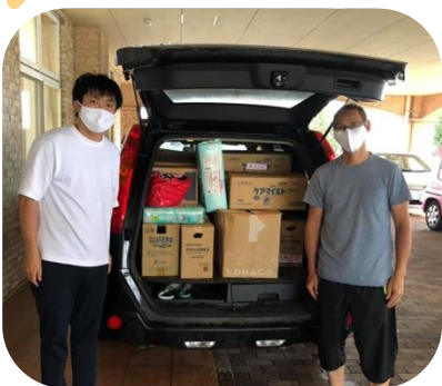
物資を回収してくださった有志の方

7月6日、九州南部豪雨の被災地のために何かできることはないかと思っていた矢先、被災地と連携をとりながら支援活動を行っている球磨郡出身の方の情報を得ました。