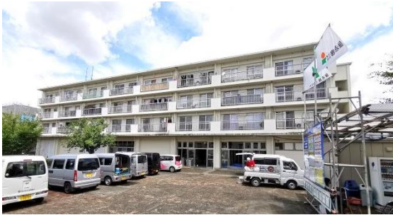
工事中の県営東町団地（7月8日撮影）