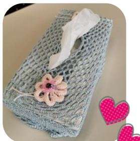
ティッシュカバー

手編みのキュートな暖簾(長い鎖編みが十数本、それぞれの先に毛糸で編んだイチゴが揺れる)をくぐってお部屋に入ると、涼しげなラメ入りの糸で編まれたティッシュカバー、花瓶敷、複雑な図柄を色彩豊かに仕上げた塗り絵などの作品が目飛び込んできて思わず「わあ！すごい」と声が出てしまいました。きっと長年、編み物を得意としておられるのだろうとお訊ねしたところ、「子どもの頃に家庭科で少し習ったけれど、カギ針編みだけで作品を作り始めたのは 2 年半くらい前から」とのこと。色んなものを見ては「こういうのを作ってみようかな」と閃きで作り始め、作りながら微調整を重ね作品を仕上げていくのだとか。誰に習ったわけでもなく、お手本(見本)もなく作っておられるということを知って、さらにビックリしました。