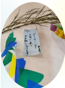
ご利用者様の短冊