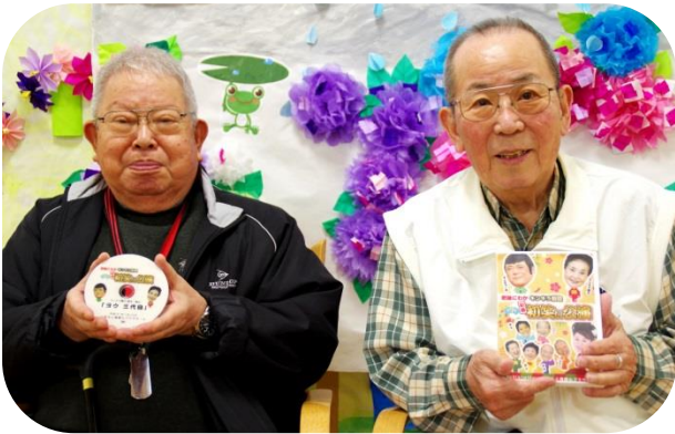
DVDを手に満面の笑みのデイサービス利用者様

5月下旬、熊本善意銀行様を通じて、肥後にわかキンキラ劇団「新春初笑い公演」のDVDをご寄贈いただきましたので、さっそくデイサービスで鑑賞することにしました。「熊本弁まっ出しで、そにゃあ面白かった」と満足した感想も聞かれ、皆さまと笑いを共有することができました。