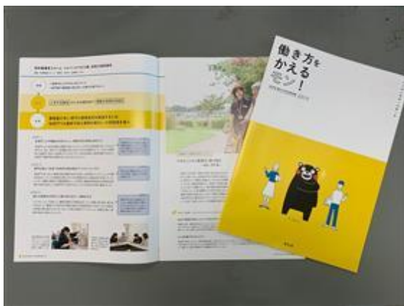
働き方改革事例集 2019

熊本県は、昨年働き方改革に関する県内事業所の取組を紹介する「熊本県働き方改革事例集 2019」を発行しました。令和元年8月21日、当施設への取材もあり、誌面掲載されました。