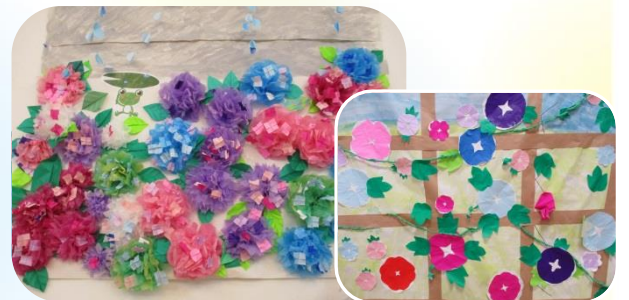
色どり豊かななあじさいと朝顔