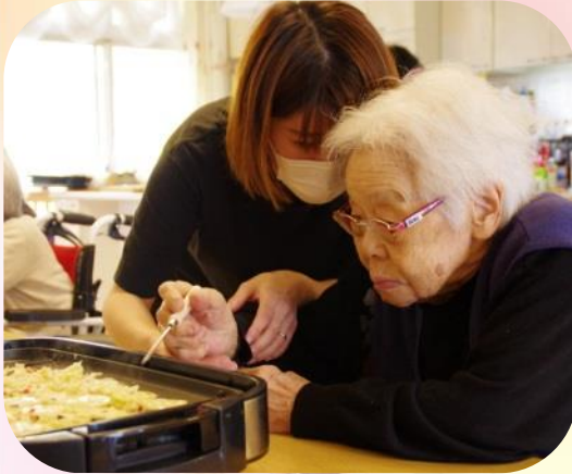
美味しいたこ焼きが出来ました

5月22日(金)ゆりユニットにて、たこ焼き調理レクを行いました。入居者様にも調理をお手伝いいただき、スタッフと仲良くたこ焼きをひっくり返されていました。