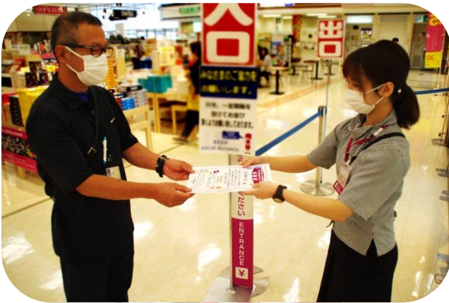
感謝状を受け取るさくら樹スタッフ(左)

6月30日、地域の皆さまの協力でコツコツと集めてきたペットボトルキャップをイオン九州株式会社イオン熊本店へ届けてきました。