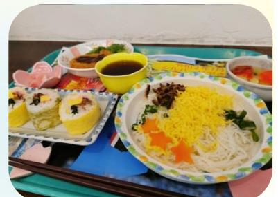
七夕をイメージした鮮やかな行事食