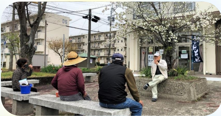
パティオ前のベンチでコーヒーを飲みながら 談笑する地域の皆様