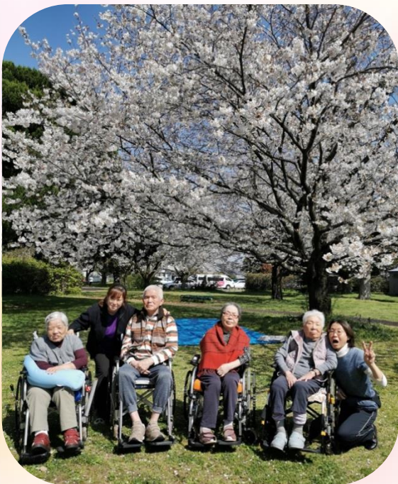
満開の桜を背景に

春先のぼかぼか陽気に誘われて、近くの公園へ桜を見に行きました。久しぶりの外出を心待ちにされていたせいか、車中も会話が弾み目的地へ。例年より少し早い開花のため、桜はほぼ満開に咲いていました。