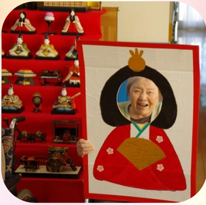
笑顔が素敵ですね