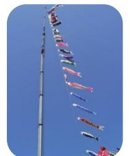
敷地内より撮影させていただきました