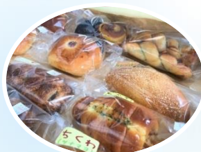
色んなパンがたくさん! 迷ってしまいます

熊本市東区東町3丁目6番 泉宮東町団地22棟1階 電話:096-285-4800 Mail:higashi-kouryu@108kai.com