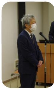
開式・閉式の辞 吉本法人本部長