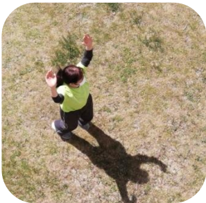
無事に降りられました