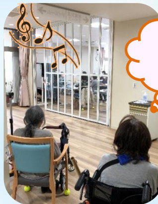
オカリナの音色を楽しむ利用者様