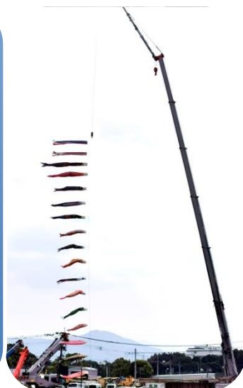
元気に泳いでいます

さくら樹周辺にある、重機会社「重建」様の敷地に見事な鯉のぼりが突如お目見えしました。大型のクレーンに繋がれた大小様々な鯉のぼりは、群青の空高く勇壮に泳ぐ姿を見せてくれました。入居者様、デイ利用者様は「のびのびと泳ぎよるねー」「たくさんおってすごかねー」とたなびく鯉のぼりにすっかり魅了されている様子で、とても喜ばれていました。