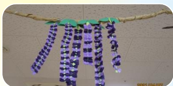
きれいな「藤の花」が出来ました