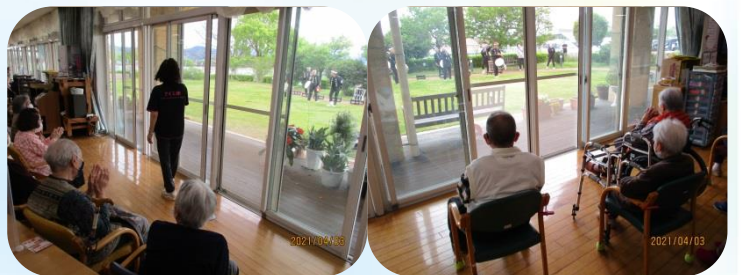
感染対策万全で鑑賞中