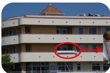
感謝を伝えるパネルを作成しました

「重建」様よりお礼の連絡をいただき、思いがけない交流となりました。素敵なサプライズに感謝申し上げます。