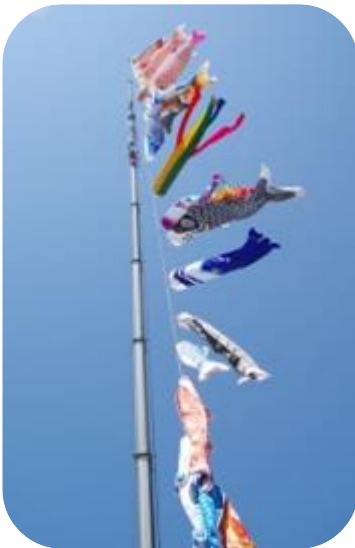
真下から覗くと凄い迫力！