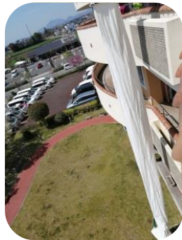
少し高さがあります

施設内の消防設備点検があり、設備業者の方が救助袋の点検をしていました。「いつ試したかなあ…」とふと思い、記憶をたどると、数年前に行った避難訓練以後使っていない気が…！業者さんによる機器点検後、安全の確認をし2階からは男性スタッフ、3階からは女性スタッフが実際に使ってみました。袋の中がらせん状になっており、意外と緩やかに下まで降りられました。