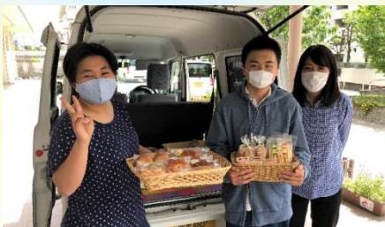
元気なスタッフさんたちが販売しています

東区小山にある『手づくりパン工房 ベーカリーさくら(託麻ワークセンター)』さんは、手作りにこだわり約40種類のパンや焼き菓子の製造販売をされています。