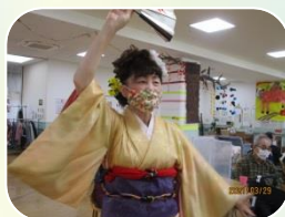
舞踊に力も入ります

さくら樹にはコロナ禍であっても皆さまを「笑顔」にさせてしまう素敵な職員さんがいます♪さくら樹ではその職員のコーナーを「遠山劇場」と呼んでいます。